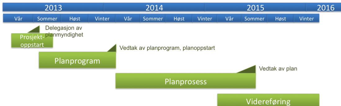
Bilde 2. Prosjektets fremdrift.

Prosjektet går over tre år. Planprogrammet skal være ferdig i begynnelsen av 2014 og selve planen senest sommeren 2015 (se bilde 2 og vedlegg 1).